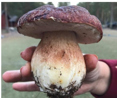
Rödbrun stensopp, modell större! (Höträsket/Nordkallottcenter).

Som under 2020 har även verksamheten under 2021 varit påverkad av pandemin. En del aktiviteter där klubben har ansett att avstånd är omöjligt att hålla har uteblivit, exempelvis skärgårdsresa med båt. På övriga exkursioner har smittsäkra avstånd varit möjliga att hålla.